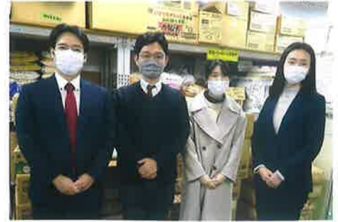
理想科学工業(株)と筑波大学大学院の皆様

筑波大学大学院システム情報工学群の院生と理想科学工業(株)が連携して、フードバンク活動の効率化、課題解決を目標に研究活動をしています。1月31日に理想科学工業と大学院の方々が生徒事務所に来所してフードバンク活動の現状、課題等について話し合いました。食品の搬送、ハンドリングや在庫管理などを研究テーマとして活動を開始するということです。フードバンク活動の発展に向けて、期待したいと思います。