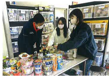
住友生命水戸支社の方(左)とインターン生2名

食品の仕分けや、入出庫の記録などボランティアの皆さんといっしょに活動をしたほか、施設を訪問しそこで働く管理栄養士さんのお話や、市役所の相談支援の現場で担当の方からフードバンクの食品が支援に使われていることの説明を聞いたりしました。