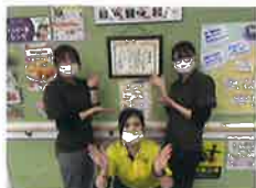
写真7 カーブス龍ヶ崎