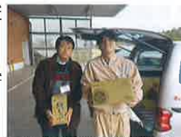
写真4 森永乳業利根工場