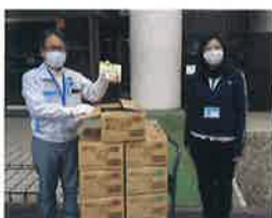
写真3 物質・材料研究機構