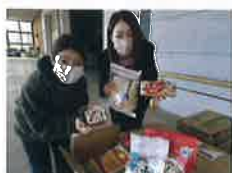
写真6 カーブス牛久中央