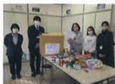
写真8 智学館中等教育学校